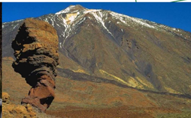
Il Picco del Teide da Las Cañadas (il cratere del vulcano)