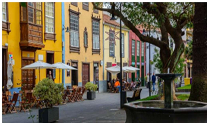
La Laguna e le sue case coloniali vi porta ad altri tempi